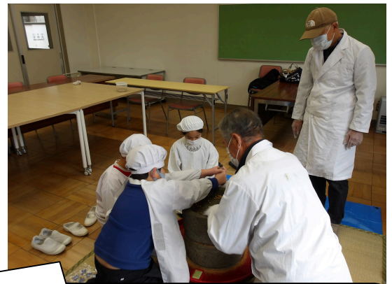
地域の先生方から学ぶ 大豆が姿を変えて→きなこへ（石臼体験）