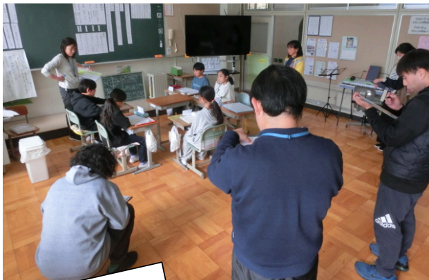
「伝えたい！」と思える 授業づくりの研究

北小は、学校・家庭・地域が支え合う大きな家族です。これからも「北小ファミリー」の絆を大切にしながら、一人一人の子どもを温かく、そして力強く育ててまいります。今後ともどうぞよろしくお願いいたします。